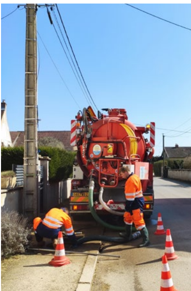
Hydrocurage du réseau pluvial