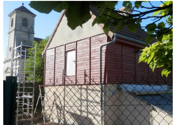
Réfection de la peinture du local chaudière