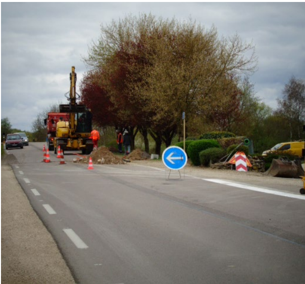
Aménagement des entrées du village pour plus de sécurité