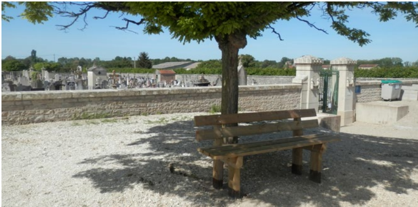
Pose d'un banc devant le cimetière

La commune effectue des travaux toute l'année pour le bien des citoyens, que ce soit l'entretien de la voirie, l'entretien des bâtiments communaux, ainsi que l'aménagement de l'espace public.