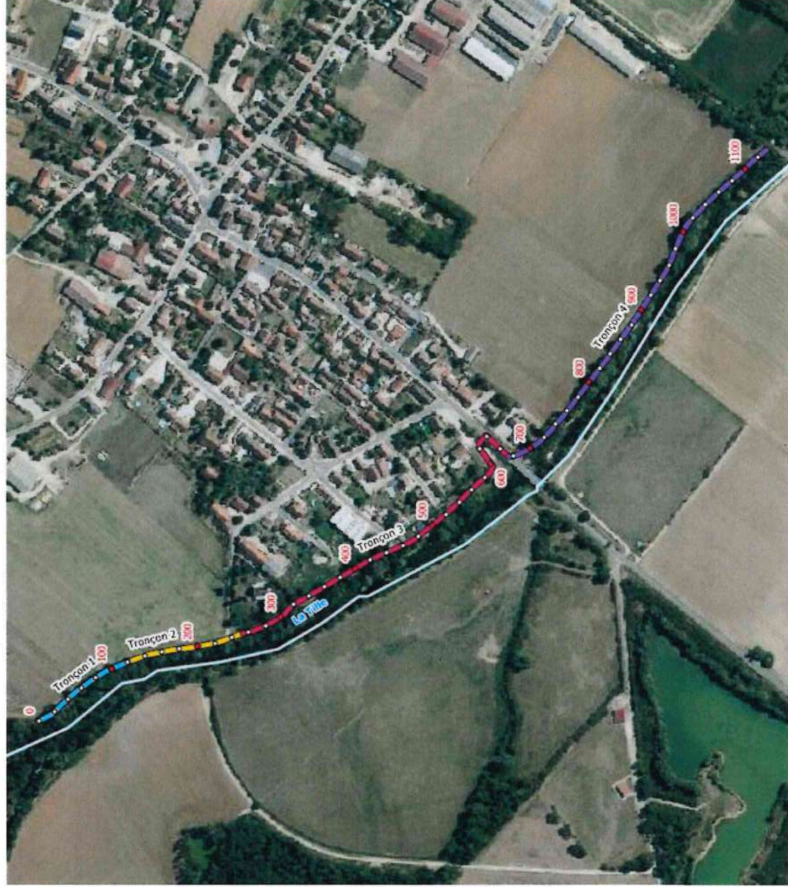
Annexe 2 : Plan du site et localisation des tronçons homogènes